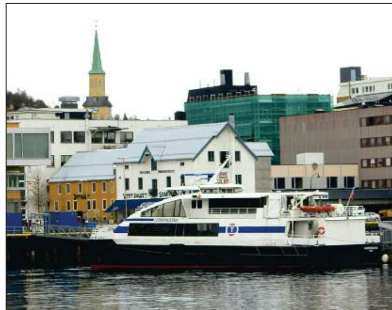
SMØR OG ØL: En gang i tiden var det smør som ble produsert i lokalene som i dag er kjent som Skarven.

Men en gang var det smør – og ikke øl – som preget huset.